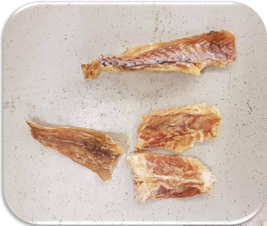
C- CUT A