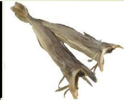
Tørrfisk for 200 år siden