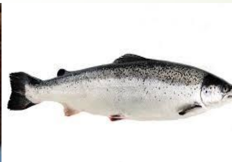
Oppdrettslaks for 30 år siden