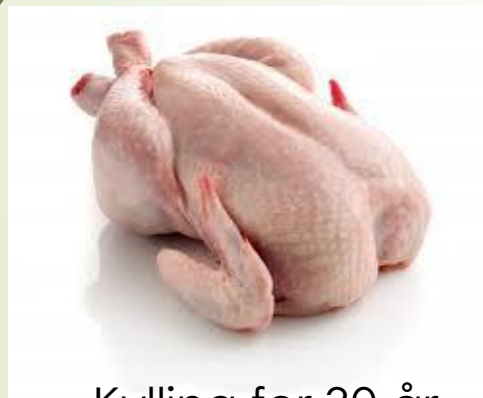
Kylling for 30 år siden