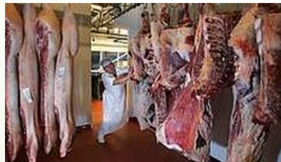
Storfe for 30 år siden