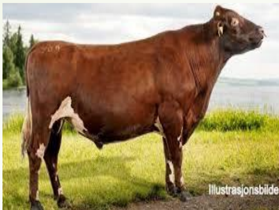
Storfe for 200 år siden