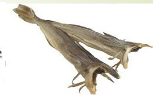
Tørrfisk for 30 år siden