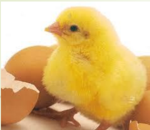
Kylling for 200 år siden