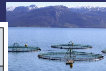
Håndboka går forskerne gjennom en rekke forhold som hver for seg kan fortelle om laksen får oppfylt sine velferdsbehov. Dette kaller forskerne velferdsindikatorer.